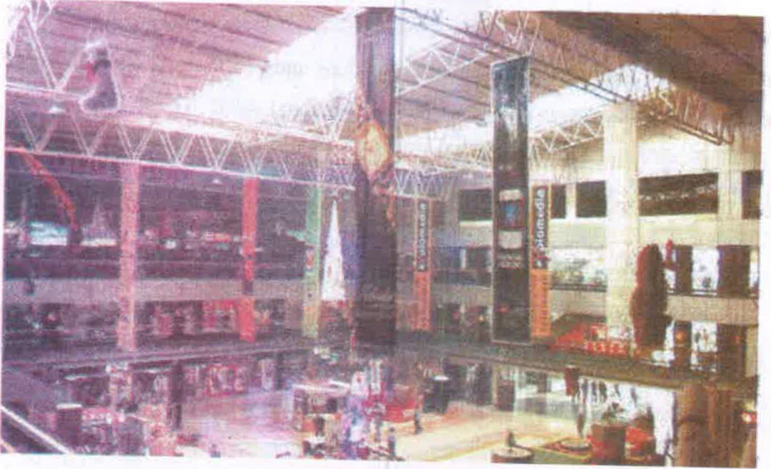
चित्र : 6.2 मॉल