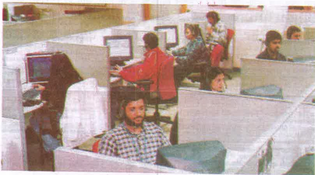
चित्र : 6.3 यह पटना स्थित कॉल सेन्टर है

निवेश (Investment) - परिसंपत्तियों जैसे- भूमि, भवन, मशीन एवं अन्य उपकरणों की खरीद में व्यय की गई मुद्रा को निवेश कहते हैं।