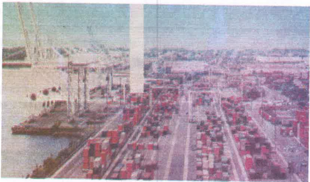
चित्र : 6.4 वस्तुओं के परिवहन के लिए कंटेनर

परिवहन प्रौद्योगिकी में बहुत उन्नति हुई है। इसने लंबी दूरियों तक वस्तुओं की तीव्रतर आपूर्ति को कम लागत पर संभव किया है। अब माल ढोने के लिए कंटेनरों का उपयोग किया जाता है। जिससे माल के दुलाई-लागत में कमी आयी है। इसी प्रकार रेल एवं हवाई यातायात की लागत में गिरावट आयी है। जिससे वायुमार्ग से अधिक मात्रा में वस्तुओं का परिवहन संभव हुआ है।